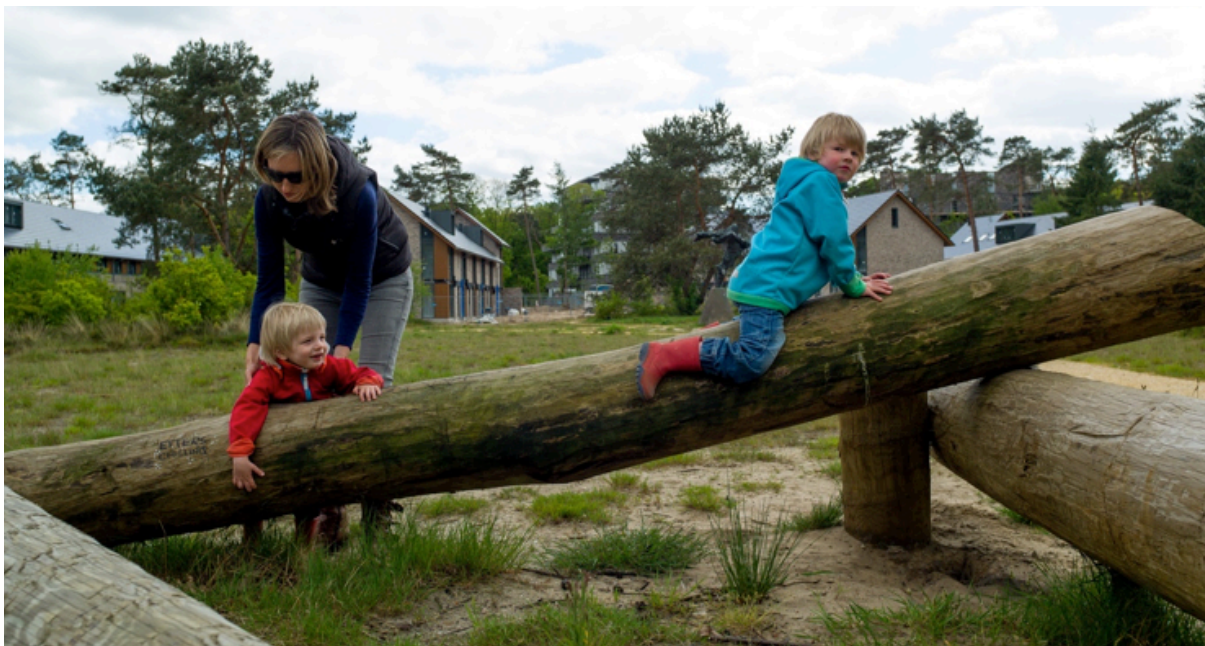
Geen standaard speelrekken, maar boomstammen uit Kerckebosch.