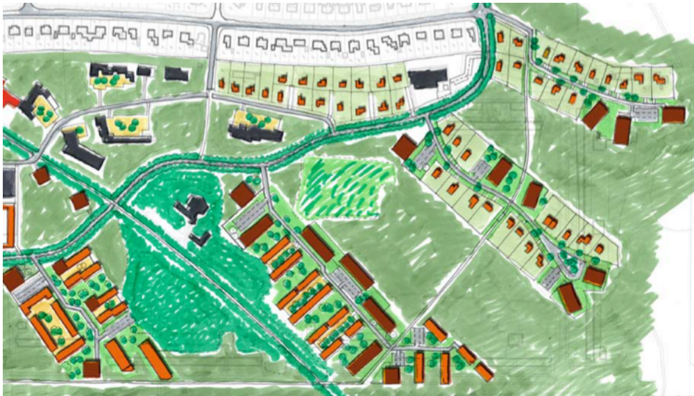
Schets uit het Masterplan Kerckebosch 2008 van BDP.Khandekar.