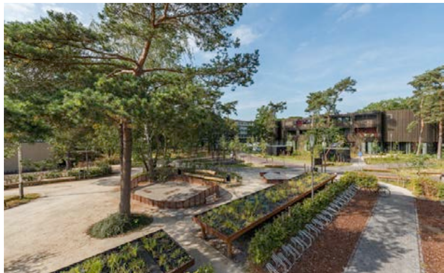
De werking van Plant-e.