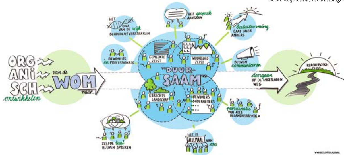
Energieleverende planten, pannavelde met energietegels.