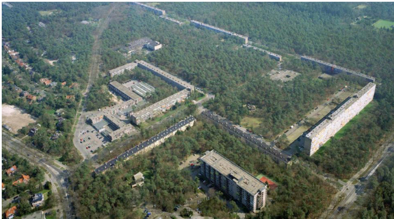
Het carré van Kerckebosch vóór de vernieuwing. Fotoğraf onbekend.

poratie Woongood Zeist. De WOM draagt zorg voor de gebiedsontwikkeling, maakt bouw- en woonrijp en zorgt in zijn algemeenheid dat de wijkvernieuwing in grote lijnen zonder al te veel overlast verloopt, met veel inbreng van bewoners en maatschappelijke organisaties. Communicatie en participatie zijn hierin de belangrijkste schakel. De WOM heeft vérgaande autonomie om het project zo goed mogelijk te dienen. Dat betekent dat er ruimte was voor zaken die niet zo vanzelfsprekend of niet zo snel door gemeente of corporatie zouden zijn opgepakt. Dit geeft ook ruimte om samenwerking met alle mogelijke belanghebbenden op te pakken.