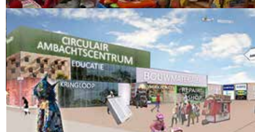
Circulair ambachtscentrum De Sleutel in Breda